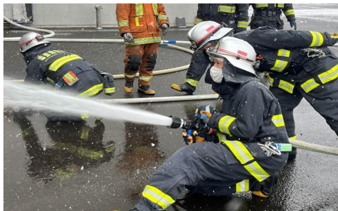
放水技術研修（放水器具操作）