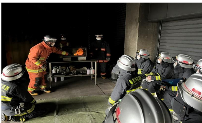
火災性状（火災の進展）