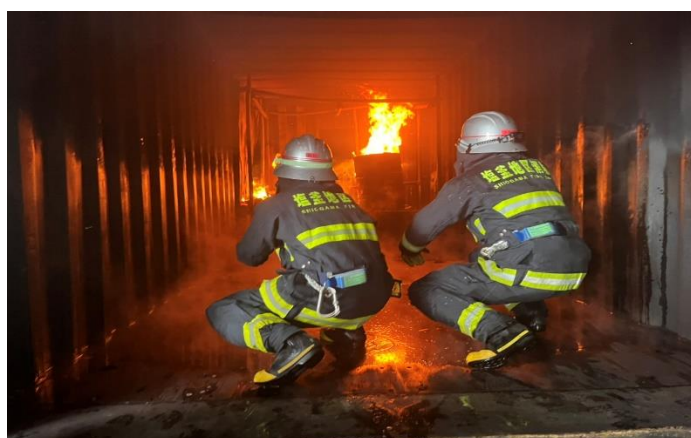
実火災体験型施設を活用した研修